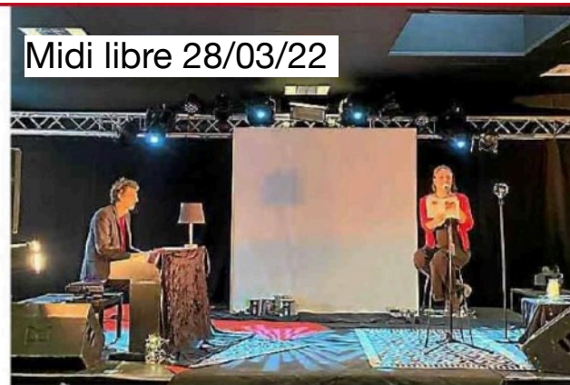
Les trois artistes multiplient les dates.