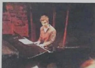
« Dans mon sang » à La Fabrick en 2019 (Vincent Dubus)